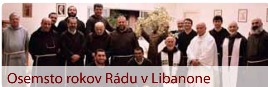
Osemsto rokov Rádu v Libanone