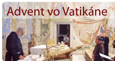
Advent vo Vatikáne

VATIKÁN- Br. Raniero Cantalamessa mal Adventné prednášky vo Vatikáne, za prítomnosti Svätého Otca a pápežskej Rodiny. Téma meditácií: Kristovi služobníci a správcovia Božích tajomstiev (1Kor. 4,1). Kňazi podľa Kristovho Srdca. Meditácia o prirodzenosti a úlohách kňazstva, vychádzajúc z dvoch textov Nového Zákona ktoré sú najpriliehavšie tejto téme: «Nech nás každý pokladá za Kristových služobníkov a správcov Božích tajomstiev» (1Kor 4,1); «Každý veľkňaz, vybraný spomedzi ľudí, je ustanovený pre ľudí aby ich zastupoval pred Bohom, aby prinášal dary a obety za hriechy» (Hebr 5,1). Hlavným cieľom prednášky bolo objasniť pôvodnú identitu a «dušu každého kňazstva», znovu jej prinavrátiť prvé miesto medzi všetkými historickými úlohami a nepodstatnosťami, ktoré sa jej pridávali počas dejín. Dávame vám do pozornosti aj poslednú knihu br. Raniera: Od Evanjelia k životu. Úvahy nad nedeľnými a sviatočnými Evanjeliami troch liturgických cyklov . PIEMME 2009 – Milano.